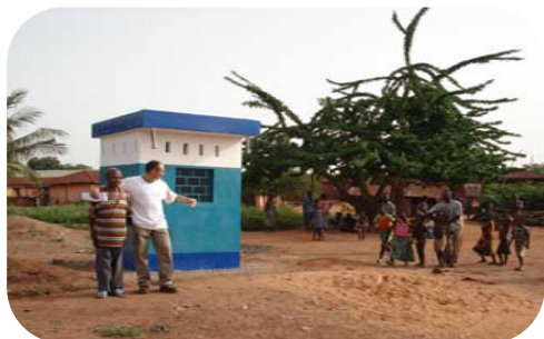
Borne-fontaine aux couleurs d'Energy Assistance

Objet : Réalisation des ouvrages d'approvisionnement en eau potable à Tado (2.000 personnes concernées)