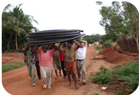
Transport des conduites