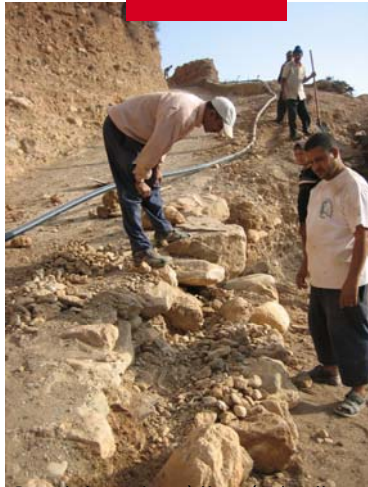
Pose de la conduite à l'entrée du village