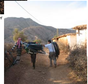
Transport des câbles, à dos d'homme et à dos d'âne