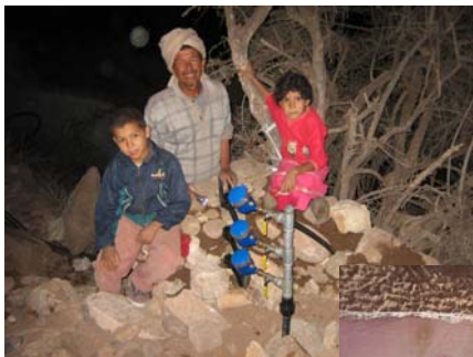
Une famille d'Enzaguen à côté des compteurs qui viennent d'être installés