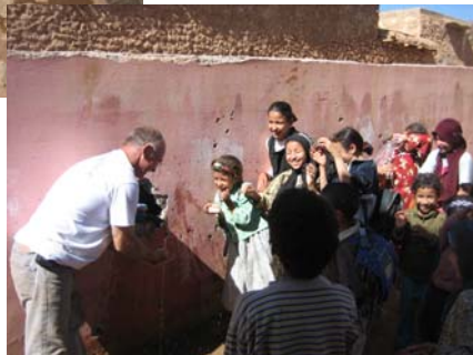
Robinet nouvellement installé à l'école